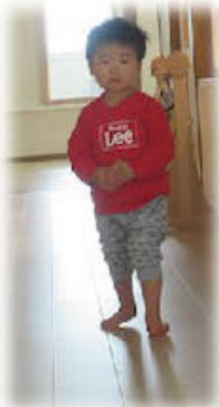
なが～いろいろかだね