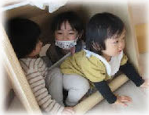
ぎゅうぎゅうだね～♪