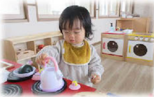
おひょういちゅう～♪