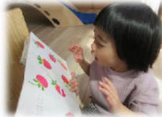
いただきますあ～す♪