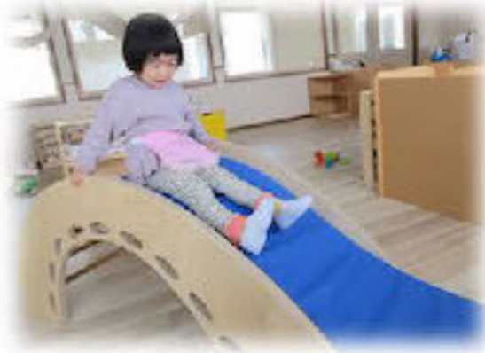
すべりだいたのしい♪