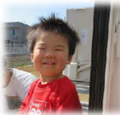
☆ほっかほか☆ きもちいいね♪