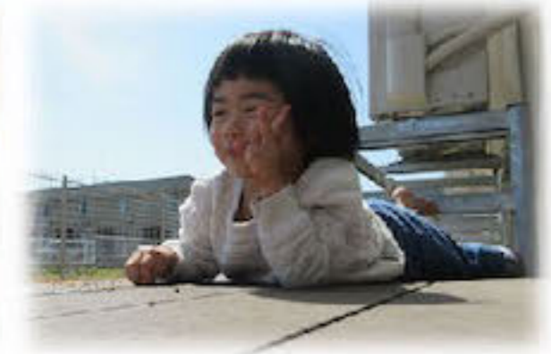
ひなたぼっこ きもちいいね☆