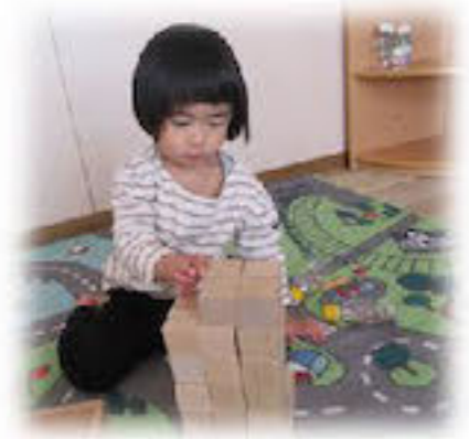
たかくつめるかな？