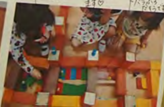
レインのおうちも 寝室やキッチン お気に入りの物など作って全部 ます♡