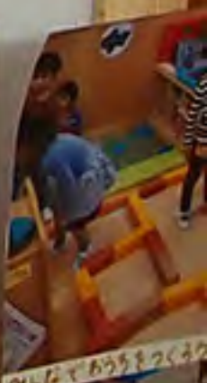
「ここがキッチンだよ」 おんがができたよ♡