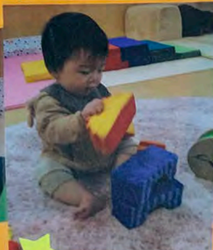
／ 好きなおもちゃをみつけて遊んでいます