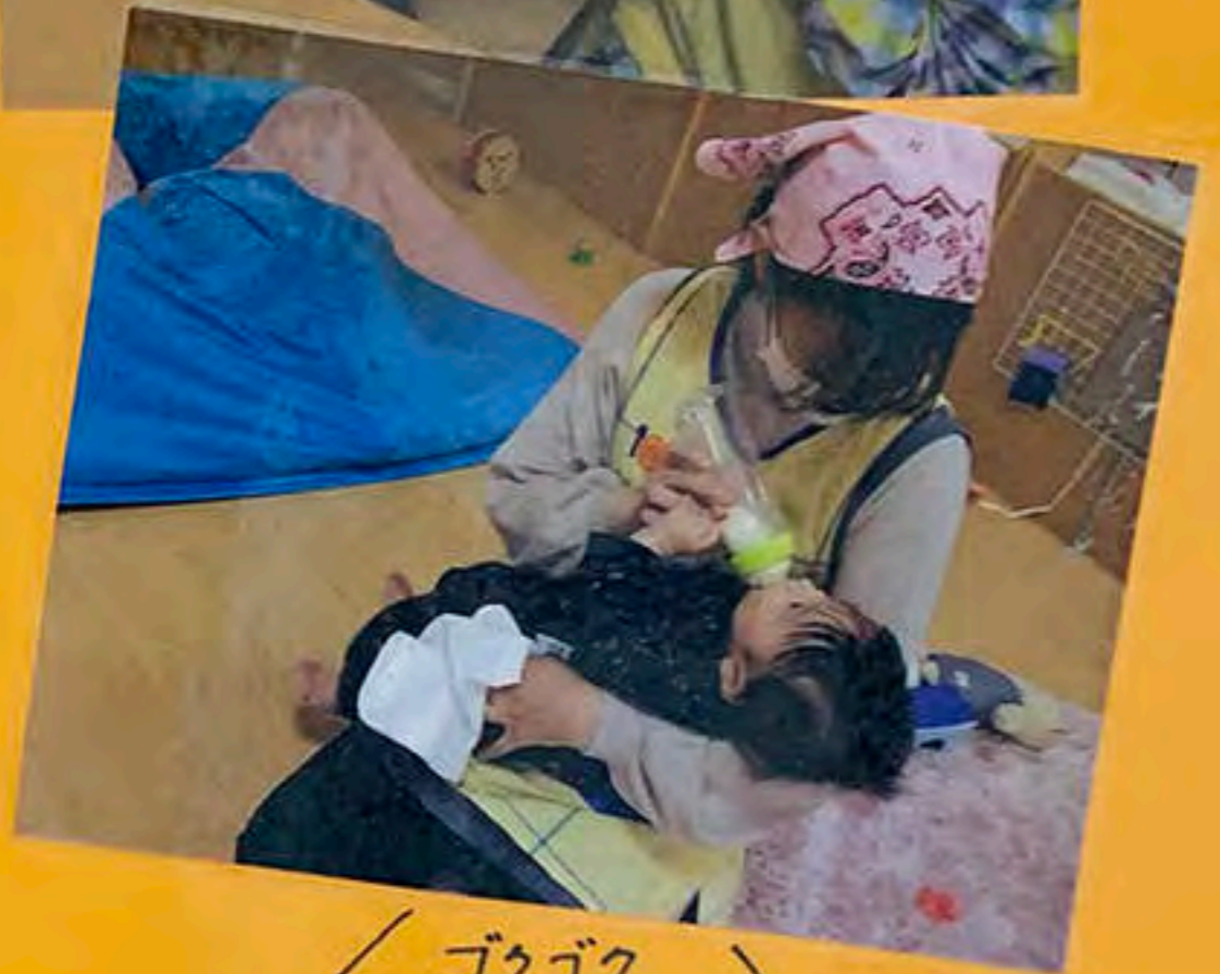
／ ゴクゴク... ！