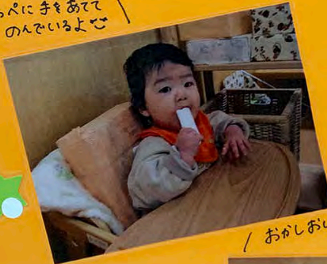
／ おかしおいしいね!