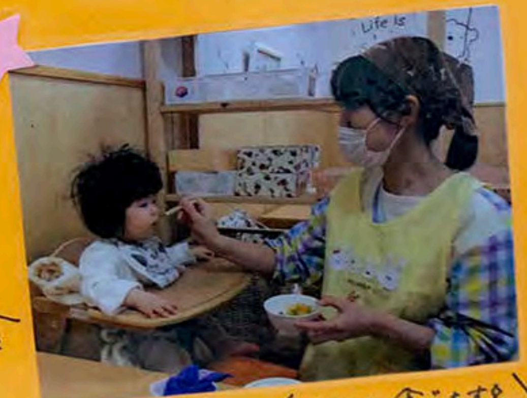
／ 何でも食べますご