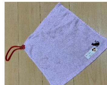
★お手拭きタオル 0歳～