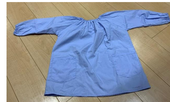
★スマック (絵画造形) 3歳～